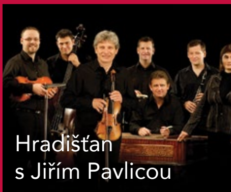
Hradišťan s Jiřím Pavlicou