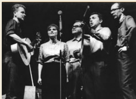
Koncert s P. Seegerem, 1964

vysvětlit jemu, jaké zadostiučinění a posilu mohou přinášet hudba a texty např. spirituálů všem v nesvobodě žijícím lidem. Myslím však, že když jsme se později rozhodli natočit alba renesančních melodií z Prahy, českých a moravských lidových balad nebo výběr písní našeho obrození, někde v pozadí našeho vědomí tichounce brnkalo pět strun banja našeho velkého, byť lidsky snad omylného, muzikantského vzoru.